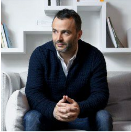
Assocom, due nuovi hub verticali dedicati a Digital e Media