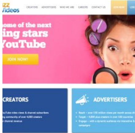
BuzzMyVideos riceve 2,5 milioni di dollari di finanziamento da United Ventures